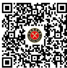
移动端注册二维码

2. 点击“参会注册”——选择“个人参会” / “团体参会”（二人及以上可使用团体注册）——点击注册。